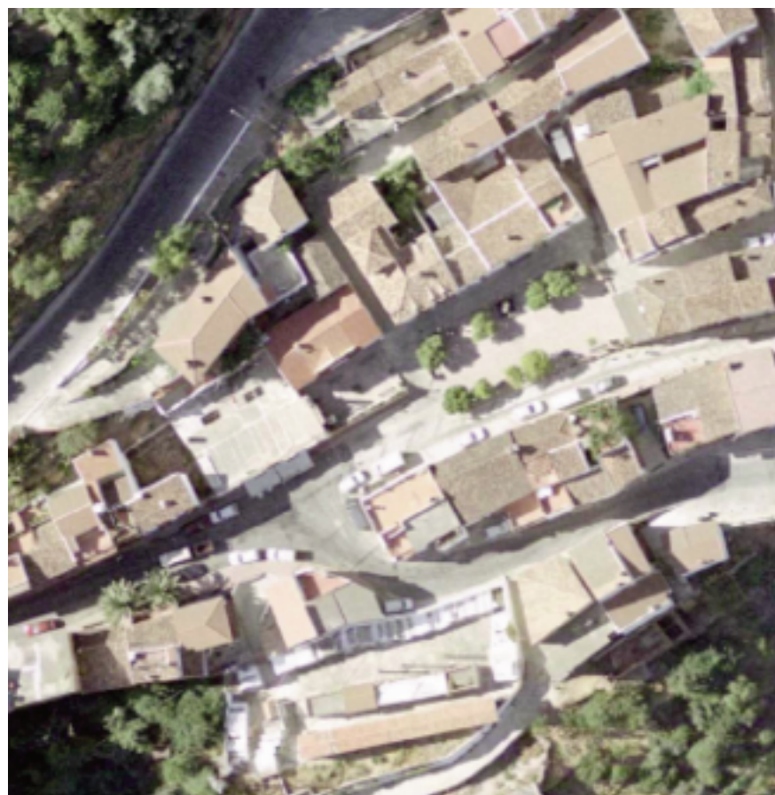
Callejero del municipio de Algotocín