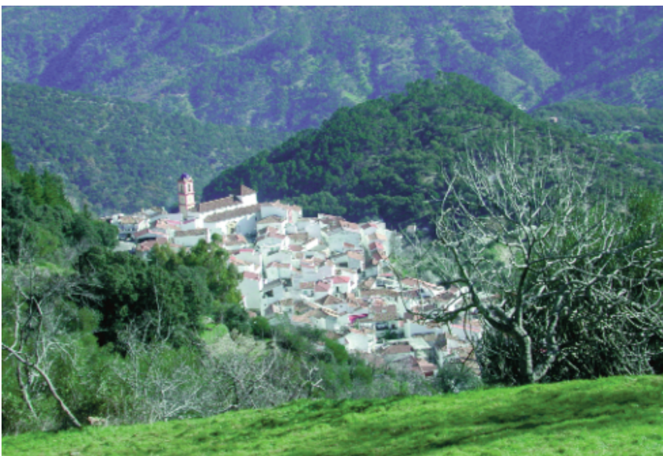
La torre campanario de Algatocín es uno de los elementos arquitectónicos más espectaculares del pueblo

La superficie urbana del núcleo principal es de 6,6 ha, concentrando el 79% del censo total. El 21% de población restante se localiza en pequeños diseminados y cortijadas. La arquitectura tradicional del casco urbano presenta un caserío bien conservado de fachadas blancas y tejados rojizos, mientras que la nueva se caracteriza por edificios de mayor planta y nuevas técnicas arquitectónicas.