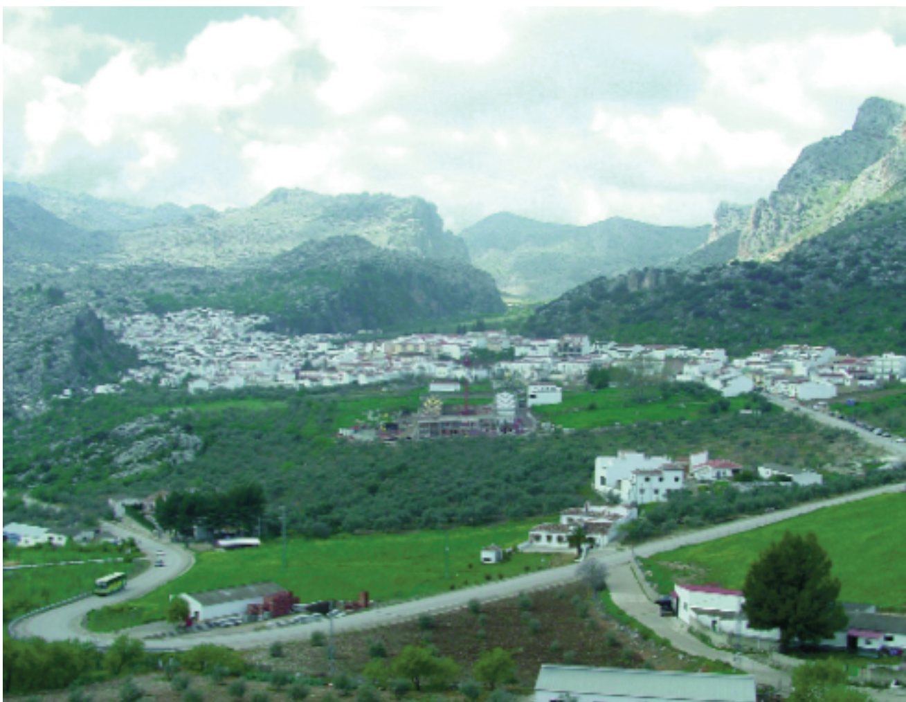
El caserío de Montejaque desde la ermita de la Virgen de la Escarihuela

El sector histórico de la villa morisca de Montejaque se asienta en un circo rocoso sobre grandes pendientes, mientras que la zona de reciente construcción o de ensanches se localiza sobre un glacis de suaves desniveles donde la topografía del lugar ofrece mejores condiciones para el crecimiento de la ciudad. La extensión de su casco urbano es de 12,39 ha donde se concentra el 99% de la población total del pueblo. En el resto del territorio municipal tan sólo existen pequeños cortijos sin llegar a conformar asentamientos rurales de relevancia.